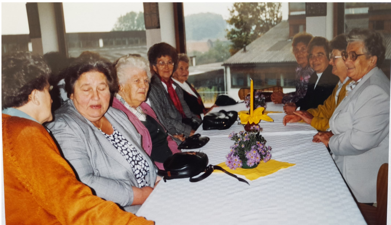
20 Jahr Feier