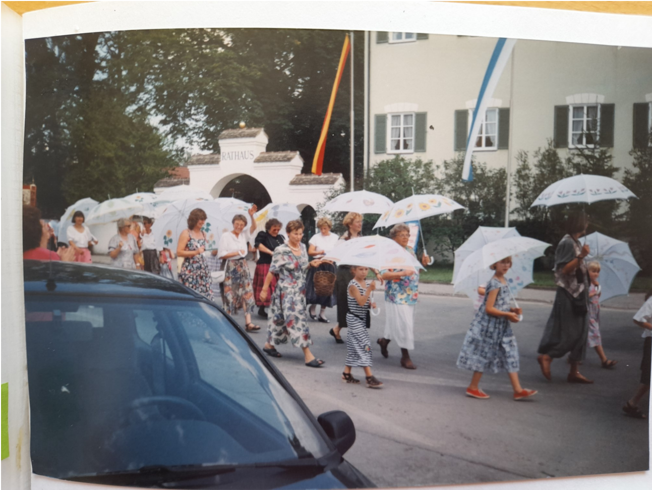
Juni 1997 und Juli 2022