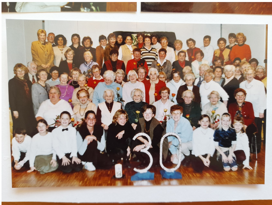
30 Jahre und 40 Jahre Frauenbund Windach