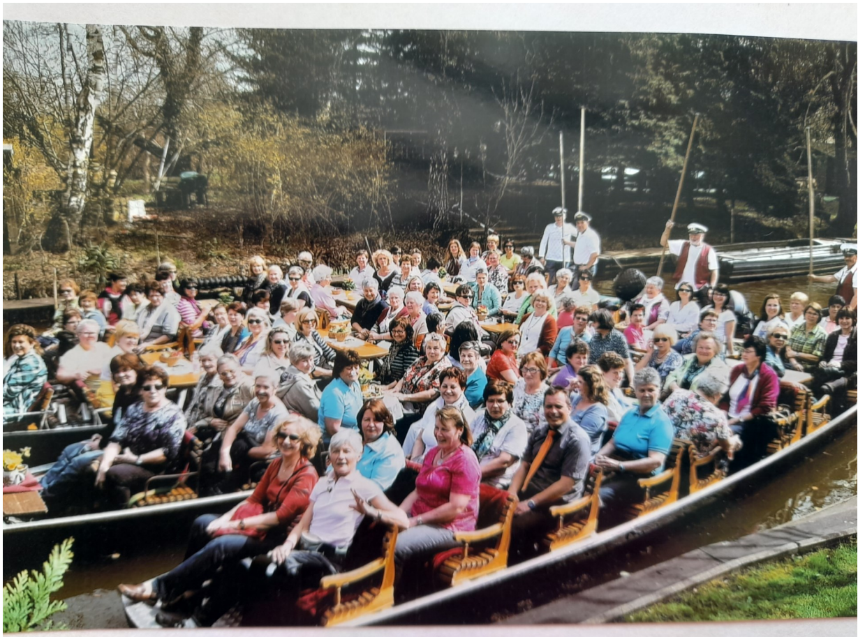
Impressionen aus 50 Jahre Vereinsleben