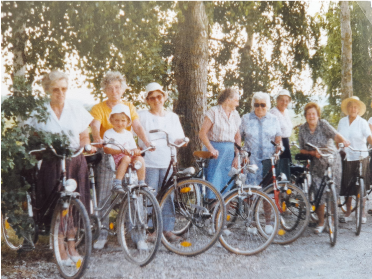
1982 und 2013